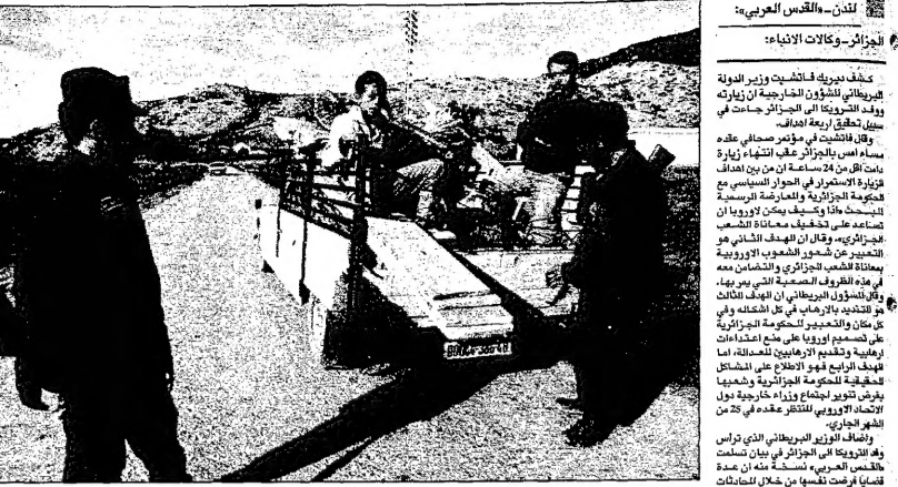
شريطان جزائريان يرحسان طريقا خروفا من هجمات على المسافرين (صورة من الأرشيف)